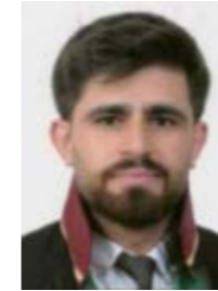
Av. Ramazan TEKİN

Ve bir kış sabahı, Yoruldu dönmekten dünyanız, Oysa siz ne kadar kolay dönüyordunuz sözlerinizden, Uyanın, uyanın! Bitsin artık rüyanız.