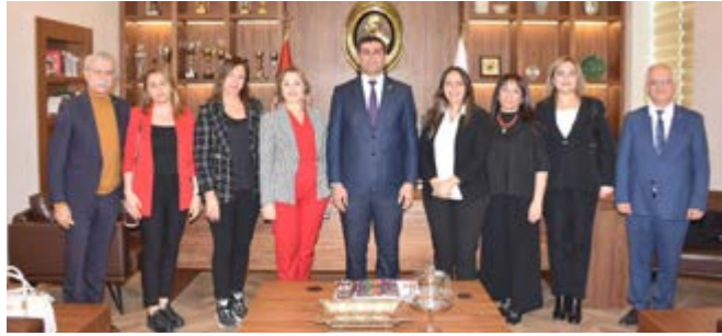
Amaç Arabuluculuk Merkezi