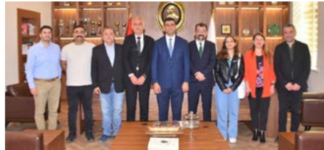
Türkiye İşçi Partisi Adana İl Başkanı ve Yönetimi Ziyareti