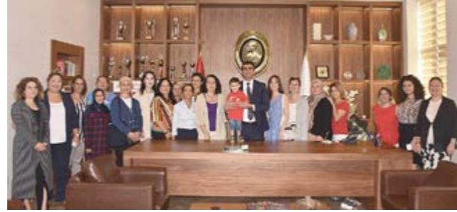
Ev Hanımları Dayanışma ve Kalkındırma Derneğinin (EVKAD-ADANA) Sabancı Vakfı