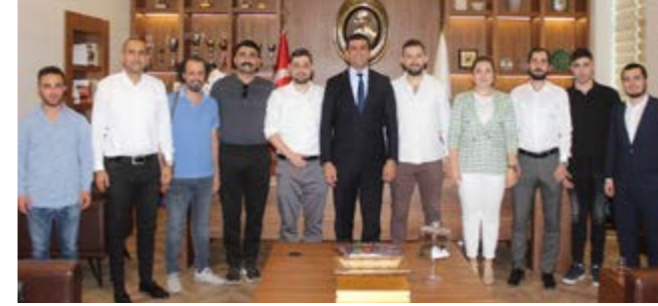
Adana Barosu Adonis Futbol Takımı