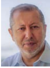
Av. Abbas BİLGİLİ

Çocukluk dönemi oyunu körebeyi hatırlarsınız. Gözleri mendil veya başka bir bezle bağlanarak ebe olan gözü bağlı çocuk kimi yakalarsa o ebe olur. Ebenin gözleri kısa süre için kapalıdır. Bir de gözlerimizin hiç açılmamak üzere kapalı olduğunu düşünelim. Hayat, görmeyenler için nasıl olurdu? Daha da kötüsünü, tüm insanların görmediğini düşünelim. İnsanlığın durumu nasıl olurdu?