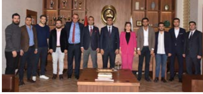
Adana Barosu Basketbol Takımı