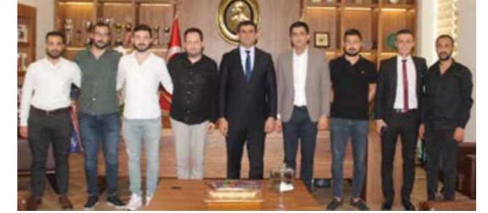
Adana Barosu Çukurova Futbol Takımı