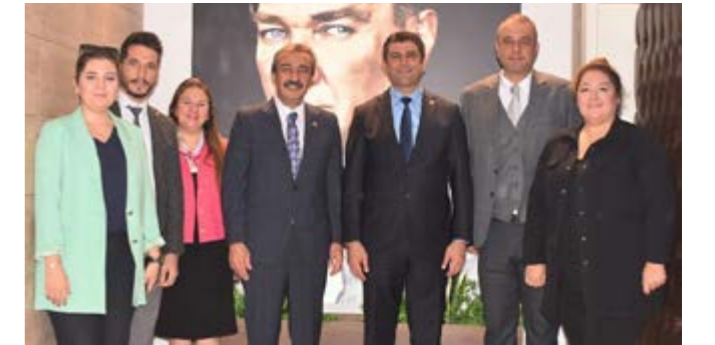
Çukurova Belediye Başkanı Soner Çetin