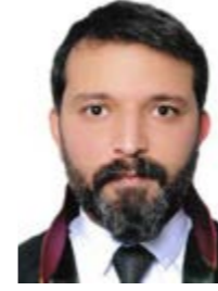
Av. Ahmet Gani KÜÇÜK