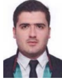
Av. Abdullah KIRGIL