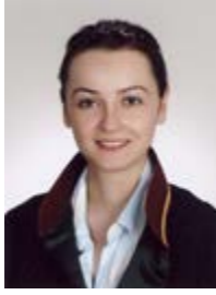
Av. Şerife Günaydın KARAKÖSE

Haruki Murakami; kitaplarında işlediği içeriklerin ne anlama geldiğini söylemeye asla yanaşmaz. “Bilinçaltının kuyularından bir görüntü ortaya çıkarsa, bunu analiz etmek zeki insanların işidir ve yazarların zeki olmasına gerek yoktur”; diye de ekler ve kendisini bir hikaye anlatıcısı olarak değil de bir hikaye gözlemcisi olarak ortaya koyar.