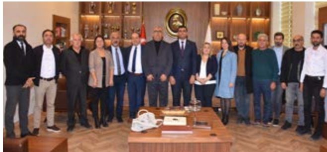
KESK Genel Sekreteri ve Sendika Temsilcileri Ziyaret