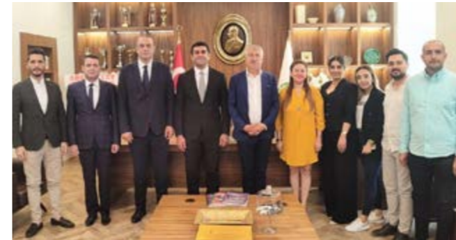
Adana Büyükşehir Belediye Başkanı Zeydan Karalar

Başkanımız Av. Gökayaz, nazik ziyaretlerinden duyduğu memnuniyeti dile getirerek, misafirlerine teşekkürlerini sundu.