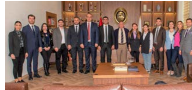
Seyhan Belediye Başkanı Akif Kemal Akay