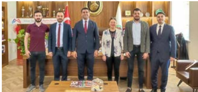
Adana Barosu Müzik Topluluğu Üyelerimiz