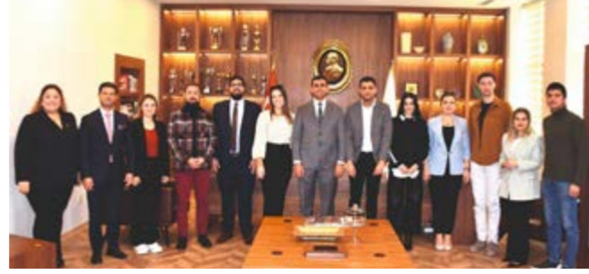
Adana Barosu Kadın ve Erkek Voleybol Takımı Ziyaret